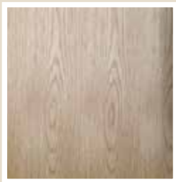
ホワイトオーク(板目)