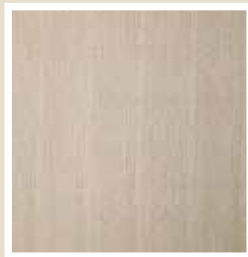
ホワイトオーク(柎目)